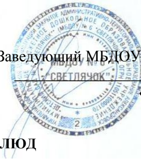
ГРАФИК ВЫДАЧИ БЛЮД